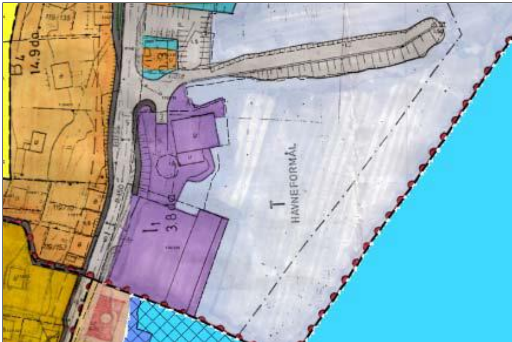
Utsnitt frå gjeldande plan for Raudeberg sentrum, planID 1439 199305.

Eksisterande avkjørsel til bygg på gbnr. 119/320 er lokalisert lengre sør enn det som er teikna inn på gjeldande plankart. Ny plan vil vidareføre etablert avkjørsel i sørvest. Då denne ikkje syner på grunnlagskartet, vil det vere behov for oppmåling av nemnte avkjørsel.