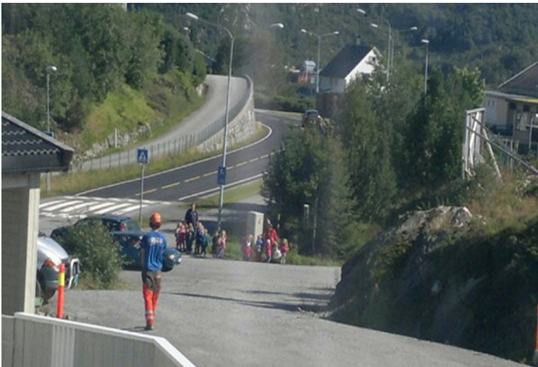
Figur 2: Ungar i flokk, som avventar to møtande bilar.

For å unngå at ungane må gå i kanten av vegbana midt i dette trafikkerte krysset, slik bilete viser, er planforslaget som låg ute til offentlig ettersyn no endra slik at det i innersving no er sett av areal for ei framtidig løysing av gangvegen (sjå plankart). Ungane vil då kunne nytte seg av fortauet frå barnehagen opp mot krysset, slik reguleringsplanforslaget har lagt opp til, men deretter krysse over før sjølv kryssområdet og gå på ein gangveg (som planen no heimlar for å etablere). Denne treng ikkje etablerast som fortau langs køyrevegen men kan gå meir direkte mot gangfeltet over RV15. Elles er det ikkje gjort endringar i planforslaget som låg ute til offentlig ettersyn.