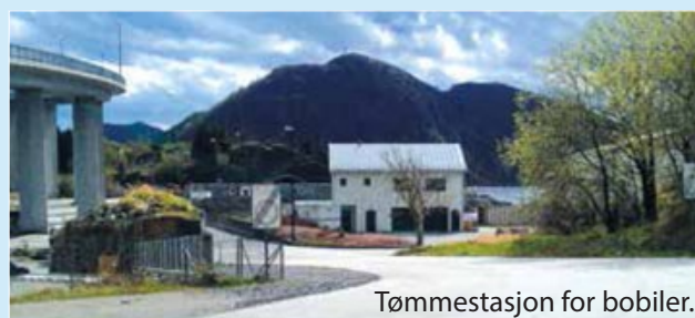
Tømmestasjon for bobiler.

Foto: Fjordenes Tidende og Thomas Hagen Fotomontasje: NORDWEST3D Trykk: Fjordenes Tidende