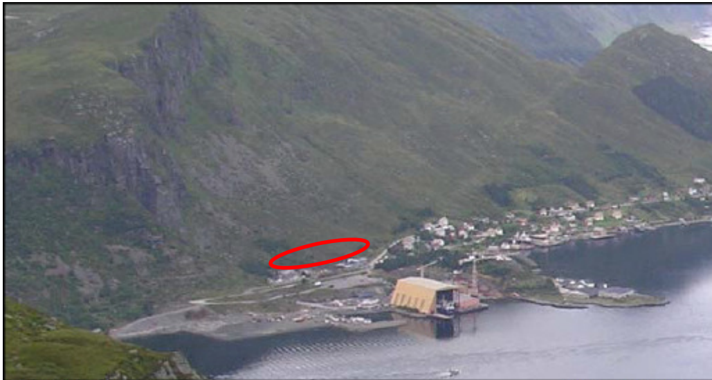
Oversiktsfoto over Kapellneset.